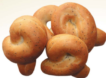
Полешки «Агринские» с изюмом, с маком