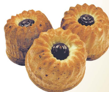
Кексик с варёной сгущёнкой