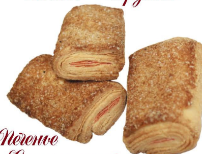
Печенье «Слоеное сахарное», «Слоеное с конфитуром», «Слоеное с крем-фишкой», «Слоеное шоколадное»