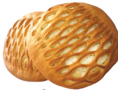
Пирог с творожной начинкой