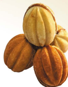
Печенье «Орешки» с варёной сушённой