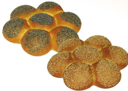
Хлеб «Ромашка» с маком, с кунжутом