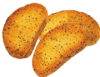
Сухари «Украинские» с маком