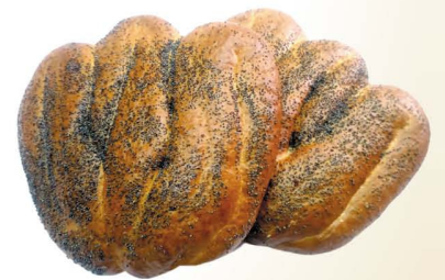
Булка «Весенняя» с маком