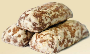
Пряники «Городецкая заправка»