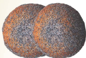
Булочная мелочь с маком, вес 100 г