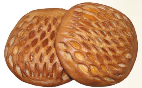
Пирог с повидлом