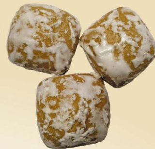
Пряники «Подмосковные молодцы»