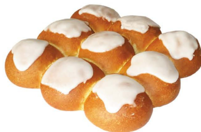
Булочка сдобная с помадкой