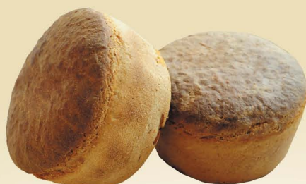
Хлеб «Украинский новый»