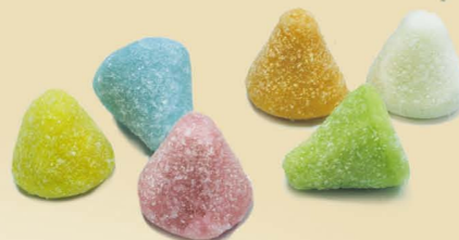
Конфеты «Киевская по-надка»