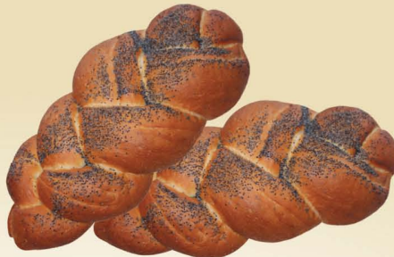
Плетёнка с маком, с курдюком