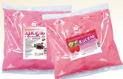
Кисель с ароматом: вишни, малины, земляники, апельсина, лимоиа, зелёного яблока