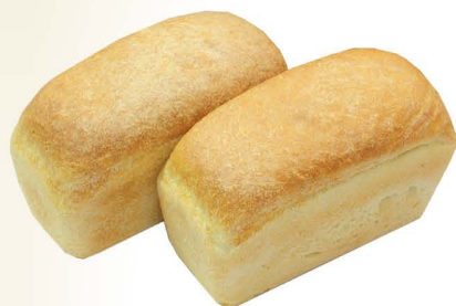
Хлеб пшеничный высшего сорта