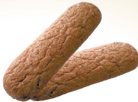
Батон с отрубями