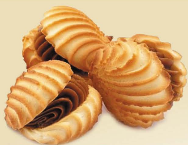
Печенье «Пеканушки» с варёной сгущёнкой