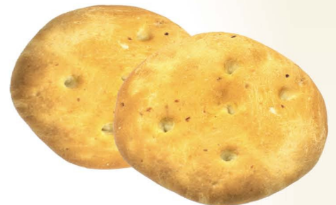
Ленюшка «Покатка» с луком