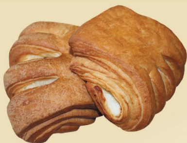
Слойка «Дубная» с творогом