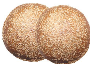
Булочная мелочь с кунжутом, вес 100 г