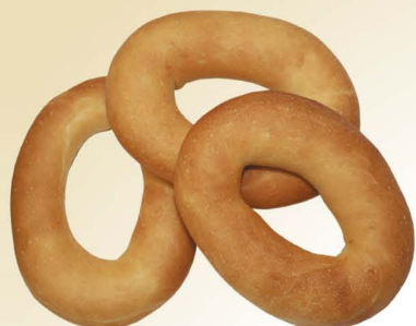
Баранки «Свободные», «Ванильные»