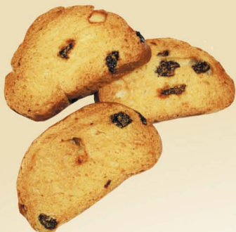
Сухари с изюмом