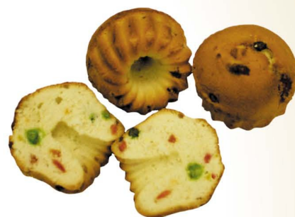
Кексик с цукатами