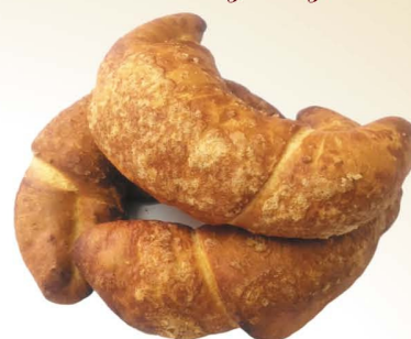
Рожки с повидлом или вареной сгущенкой