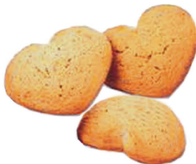
Печенье с творогом