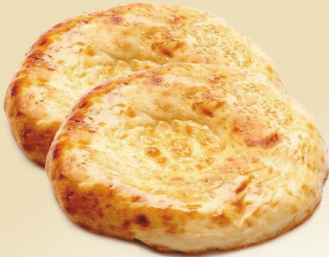
Лаваш на кефире