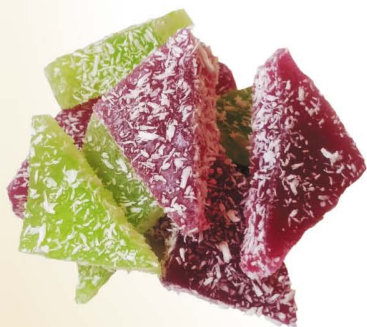
Мармелад с кокосовой стружкой