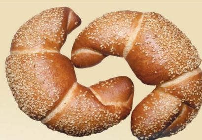
Рожки с маком, с кунжутом