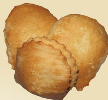
Водни с творогом