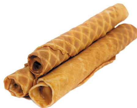
«Вафельные трубочки» со сушёнкой