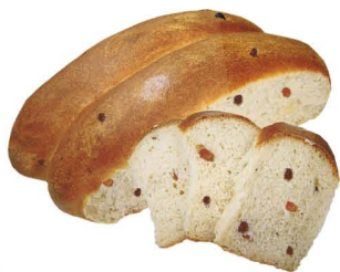
Сайка с изюмом