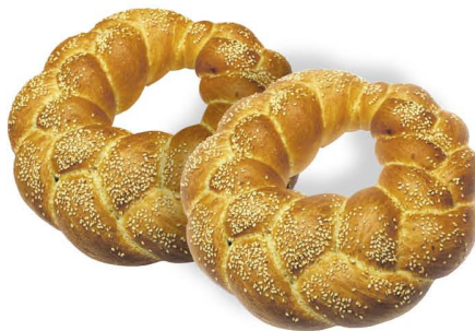
Изделия «Парижские» с маком, с курдюком